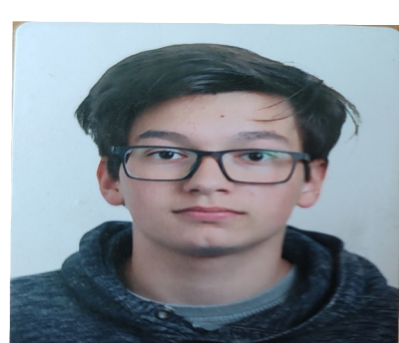
Autor: Jakub Hofman

název školy: STŘEDNÍ ODBORNÁ ŠKOLA STAVEBNÍ KARLOVY VARY p.o., Nám. K. Sabiny 159 \ 16, 360 01 Karlovy Vary