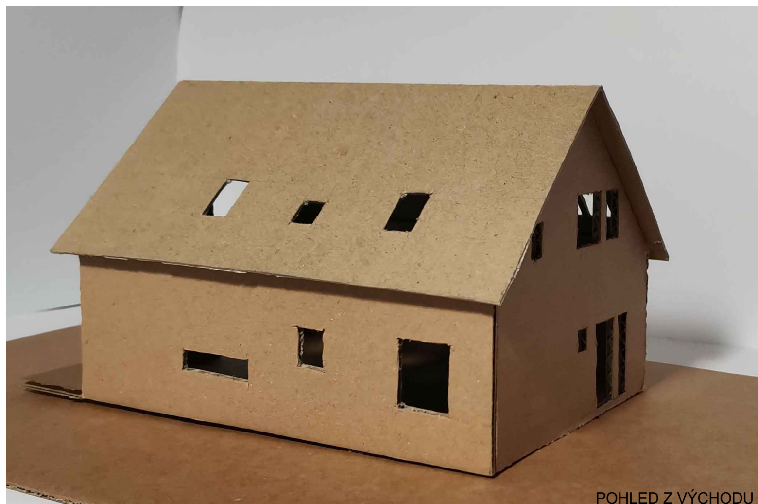
POHLED Z VÝCHODU

Jedná se o samostatně stojící objekt rodinného domu. Je umístěn na pomezí obce Novosedlice a městské čtvrti Trnovany, kousek od centra města Teplice. V dochozí vzdálenosti najdeme zastávku, obchod, školu a další občanskou vybavenost. Stále se ovšem nacházíme ve velmi klidném prostředí plném zeleně a výhledů, jak na Krušné hory, tak České středohoří.