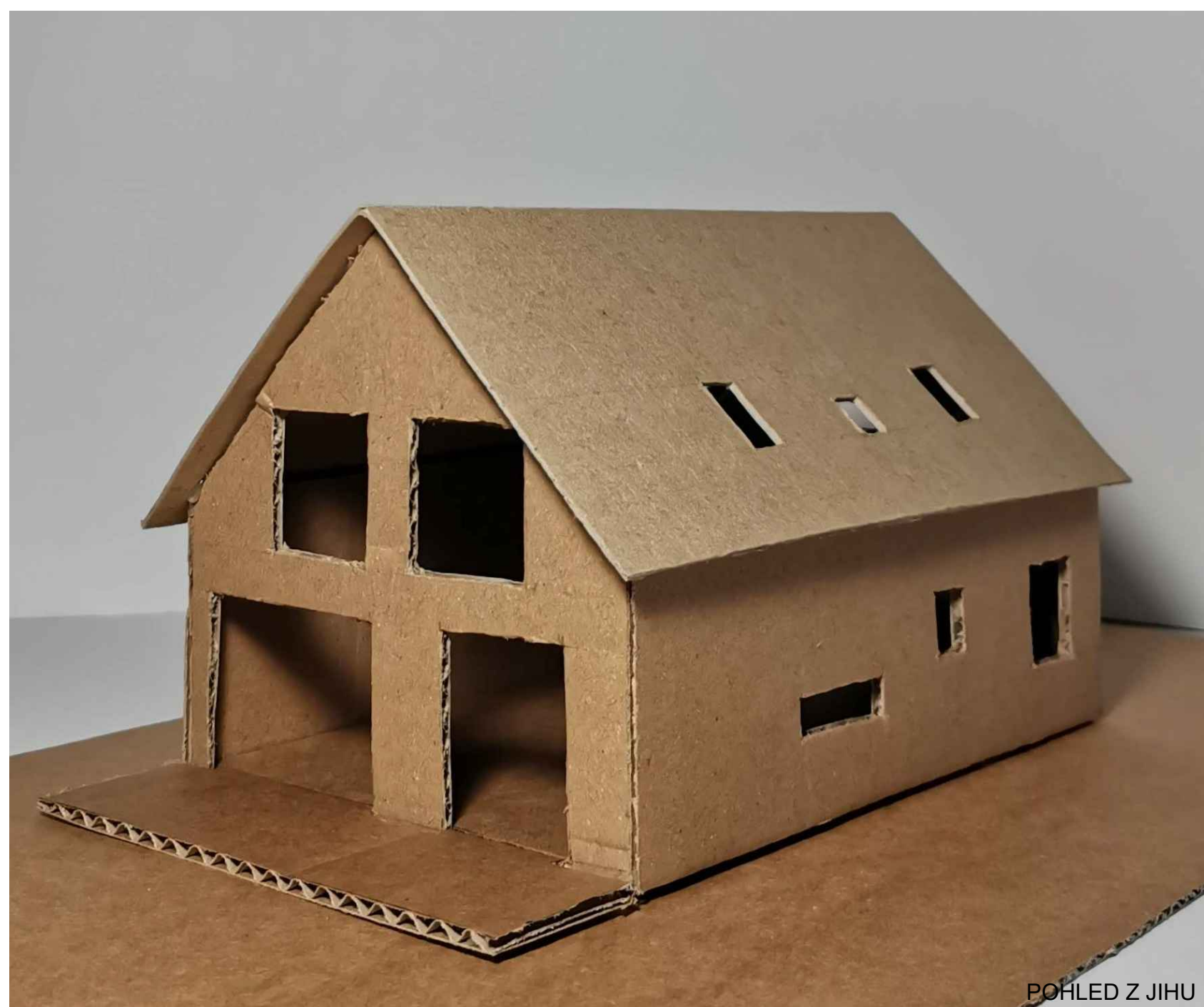
POHLED Z JIHU

Obdélníkový půdorys domu má rozměry 12,13 x 8,13 m. Fasáda bude bílé barvy, krytina na sedlové střeše tmavě šedá, výplně otvorů budou v kontrastní žluté barvě.